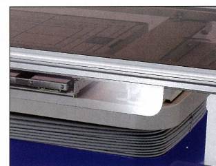
■ 手挟み防止カバー